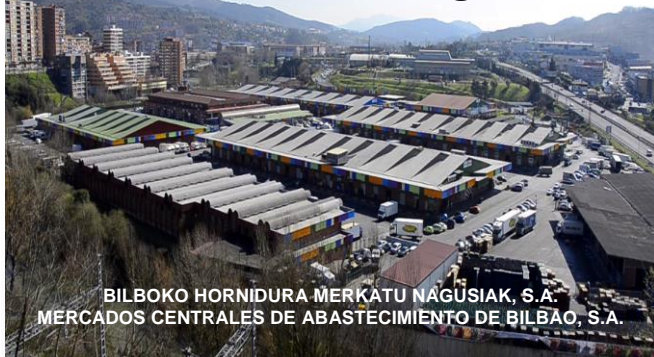
BILBOKO HORNIDURA MERKATU NAGUSIAK, S.A. MERCADOS CENTRALES DE ABASTECIMIENTO DE BILBAO, S.A.